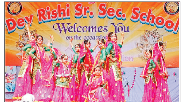
राई। देवऋषि स्कूल के छात्र वार्षिकोत्सव में सांस्कृतिक कार्यक्रम प्रस्तुत करते हुए।