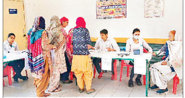
सोनीपत। शिविर में मरीजों की जांच करते हुए चिकित्सक।

मंगलम सारथी फाउंडेशन तथा उजाला सिग्नस अस्पताल पटल के संयुक्त तत्वाधान में कुमासपुर गांव में शिविर लगाई गई