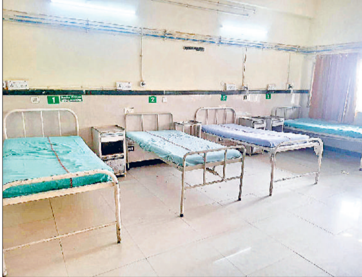
सोनीपत। अस्पताल में स्थापित वार्ड में ऑक्सीजन बेड।

बता दें कि कोविड-19 संक्रमण के दौरान स्वास्थ्य विभाग की तरफ से अस्पताल परिसर में ऑक्सीजन की कमी को दूर करने के लिए 200 लीटर प्रति मिनट (एलपीएम) का ऑक्सीजन प्लांट लगाया था। इसके शुरू होने से रोजाना 40 सिलिंडर ऑक्सीजन का उत्पादन किया जाता है। इसके बाद कॉर्पोरेट सोशल रिस्पॉसिबिलिटी (सीएसआर) के तहत गुजरात की एलएंडटी कंपनी ने 1000