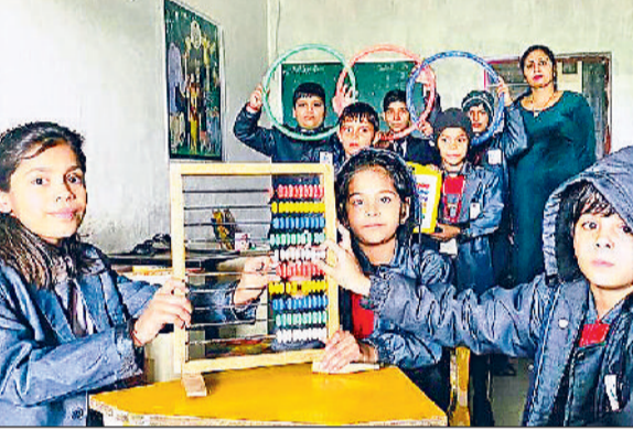
प्रतियोगिता में अपनी प्रतिभा दिखाते हुए विद्यार्थी।

गोहाणा-महम मार्ग पर गांव मदीना में स्थित डीवीएम पब्लिक स्कूल में आयोजित गणित प्रश्नोत्तरी प्रतियोगिता में विद्यार्थियों ने अपनी प्रतिभा का उत्कृष्ट प्रदर्शन किया। प्रतियोगिता के बाद विद्यार्थियों को परीक्षा की तैयारी के टिप्स भी दिए गए।