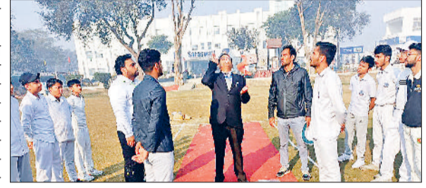
सोनीपत। क्रिकेट प्रतियोगिता के दौरान टॉस करवाते हुए प्राचार्य।