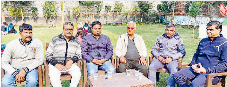
गोहाना। जानकारी देते हुए कमेटी के सदस्य।

22 जनवरी को अयोध्या में होने वाले श्री राम मंदिर प्राण प्रतिष्ठा उत्सव की तर्ज पर उसी दिन समान उत्सव गोहाना में भी होगा। इस के लिए अयोध्या से अक्षत दीपक आएंगे जिन्हें गोहाना के हर घर में पहुंचाया जाएगा। उत्सव के दिन हर घर में दीपक जलेंगे तथा हर मंदिर में कीर्तन होगा।