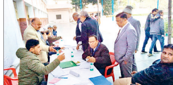
सोनीपत। हिंदू विद्यापीठ में मतदान प्रक्रिया के दौरान बाहर बैठे समिति सदस्य।