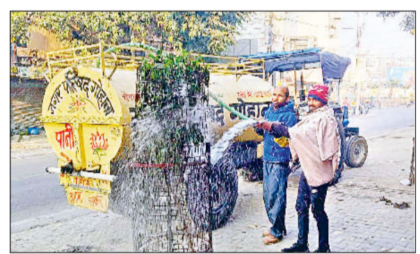
गोहाणा। पौधारोपण करते हुए संगठन के सदस्य।